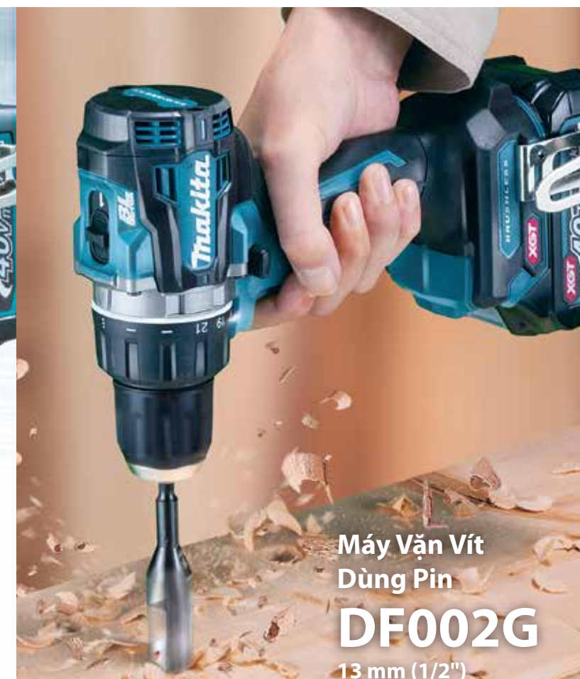
Máy Vặn Vít Dừng Pin DF002G 13 mm (1/2")