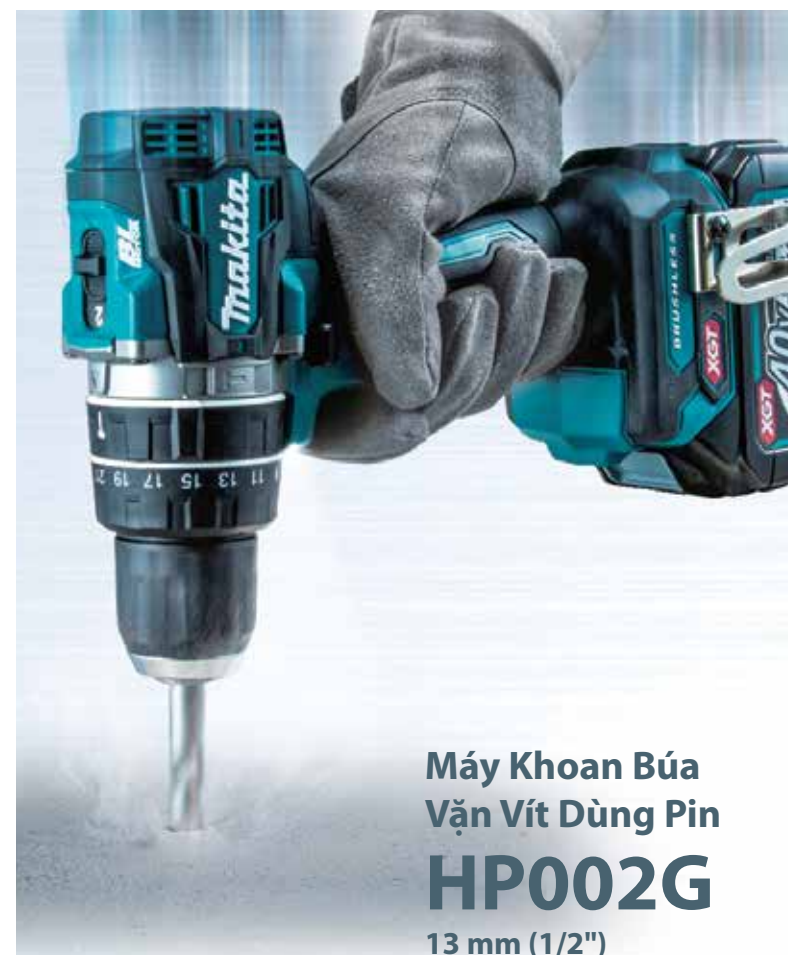
Máy Khoan Búa Vặn Vít Dừng Pin HP002G 13 mm (1/2")