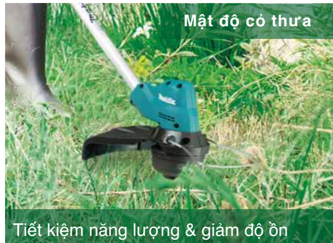
Mật độ cỏ thưa

Số vòng quay dao động từ 4,000 - 6,000 vòng tùy thuộc vào mật độ cỏ