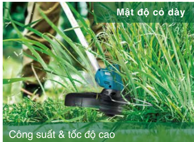
Mật độ cỏ dày