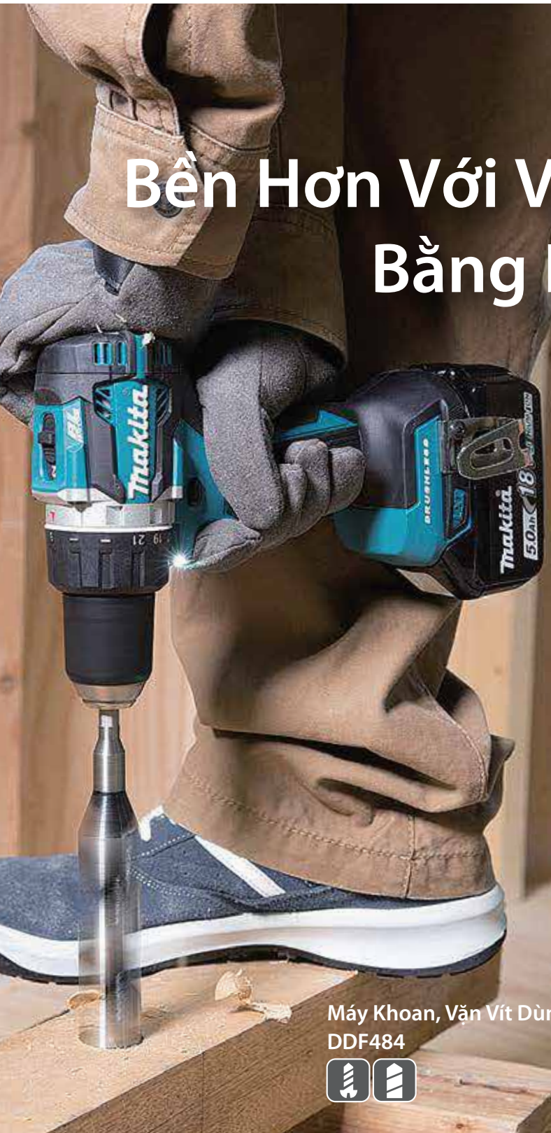
Máy Khoan, Vặn Vít Dùng Pin DDF484